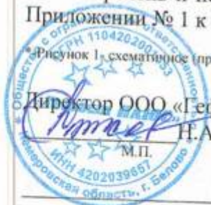
Рисунок 1, схематическое (приблизительное) изображение жилого дома и земельного участка.

Перечень и периодичность выполнения работ по уборке придомовой территории указана в Приложении № 1 к настоящему договору.