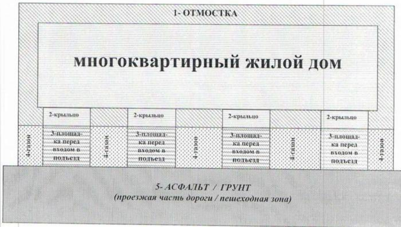
Рисунок 1*: План-схема придомовой территории МКД, убираемой в пределах тарифа, перечня и периодичности выполнения работ по содержанию земельного участка, установленных Приложением № 1 к настоящему Договору.

К придомовой территории многоквартирного дома, убираемой управляющей организацией относится: